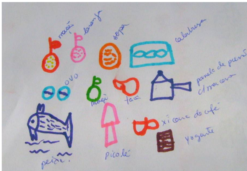
Figura 2. Os alimentos, na representação de Lucas Souza, 2009.