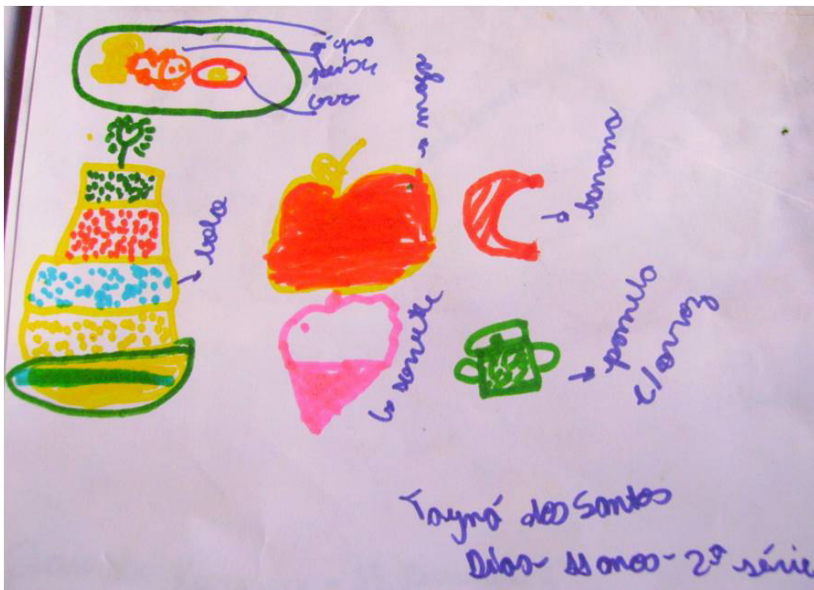
Figura 3. Os alimentos, na representação de Tayna dos Santos, 2009.

Os moradores cozinham os alimentos no fogão a lenha e não têm hábito de assar bolos no que eles consideram fogões rudimentares. O bolo é um alimento considerado especial, consumido em festas de aniversários de crianças, raramente em festejos de adultos. De acordo com Senra (1996), os regimes alimentares funcionam como idiomas de diferenciação; no caso citado, diferenciação interna e geracional, marcando um grupo de idade, o que significa que o bolo é o alimento do desejo das crianças, não dos adultos.