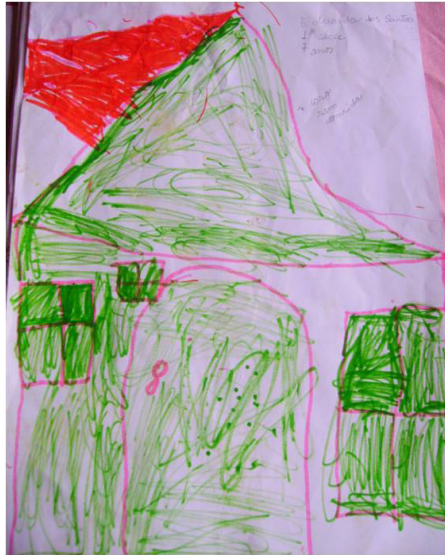
Figura 5. A casa onde não há comida. Desenho de Eduarda dos Santos, 2009.

O quadro alimentar que se presencia atualmente em Boa Vista é: dependência do