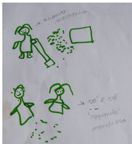
Figura 4. Parte do processamento da mandioca na visão de Rodrigo Santos, 2009.

após a introdução da mandioca no continente africano ela passou a ser cultivada em grande escala no Brasil, para ser exportada à África se transformando no alimento principal na dinâmica do comércio escravagista, se consituindo assim em um dos principais fatores da articulação da economia do Atlântico sul. Se enfatizo a importância da cultura da mandioca na história é para mostrar o quanto ela ainda exerce forte papel na economia das comunidades agrícolas da Amazônia.