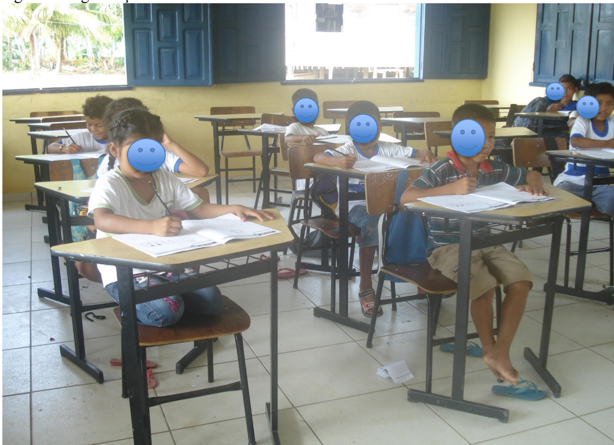
Figura 2. Organização enfileirada da sala de aula