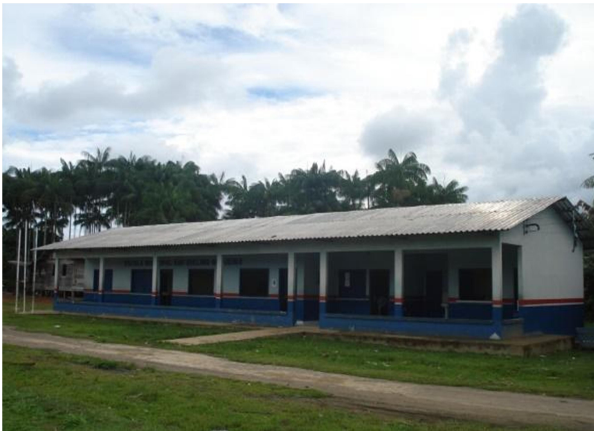
Figura 1. Escola Municipal Capitão Avelino