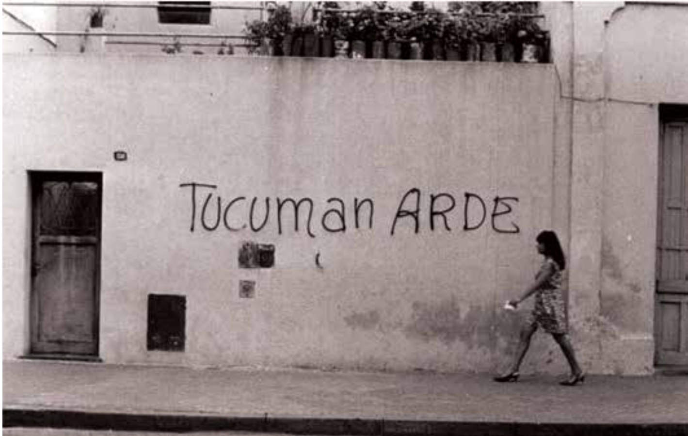
Edgardo-Antonio Vigo Tucumán Arde Argentina, 1970