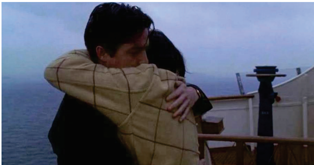
Figura 13 – Possível recomeço?