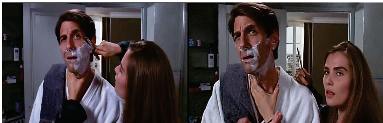
Figura 7 – Mimi demonstra estranheza e prazer pela dor em Oscar.

Oscar, enquanto conta, é de quem se vangloria e diverte-se com o horror estampado na face e no corpo tenso de Nigel. E justifica, “só dou detalhes para mostrar como estava escravizado de corpo e alma por essa criatura, cujos encantos o impressionaram” (LUA, 1992). Nigel disfarça sua repugnância e, com paciência de analista, ou seria o interesse de voyer , imagina, vê o que é narrado, excita-se. Tais cenas aumentam seu desejo por Mimi.