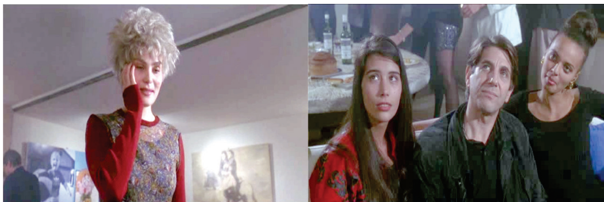
Figura 10 – Oscar ridiculariza e despreza Mimi.