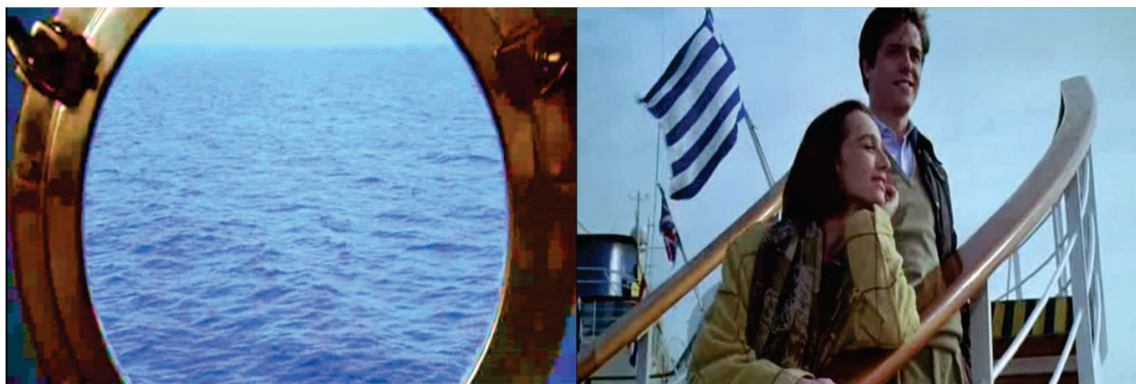
Figura 1 – Cena de abertura do filme mostra o mar calmo. Os personagens Nigel e Fiona, alegres, comemoram a viagem para a Índia.

Thomas). A partir daqui, os diálogos ferinos demonstram as reações dos indivíduos frente ao inesperado e inevitável desencadear de desejos camuflados e reprimidos de maneira consciente ou inconsciente.