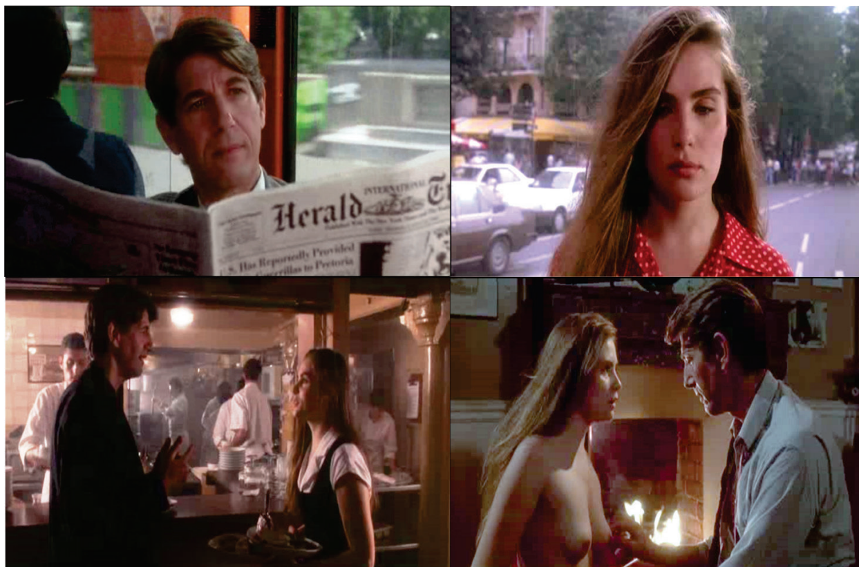
Figura 4 – O encanto dos primeiros encontros. Fonte: frames extraídos do filme Lua de Fel (1992) pelos autores.

Escritor, embora frustrado, sabe enfeitar o que faz e narra de maneira poeticamente sarcástica as suas aventuras amorosas. Todas e, principalmente, a vivida com Mimi. Herdeiro de fortuna foi morar em Paris, disposto a seguir os passos de Hemingway, Miller, Scott Fitzgerald, talvez por identificação com suas histórias