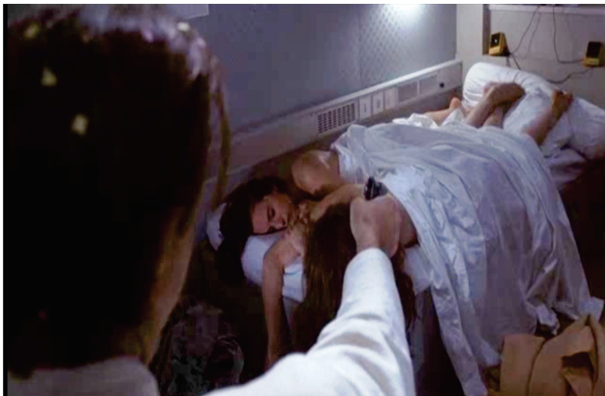
Figura 12 – Trágico final.