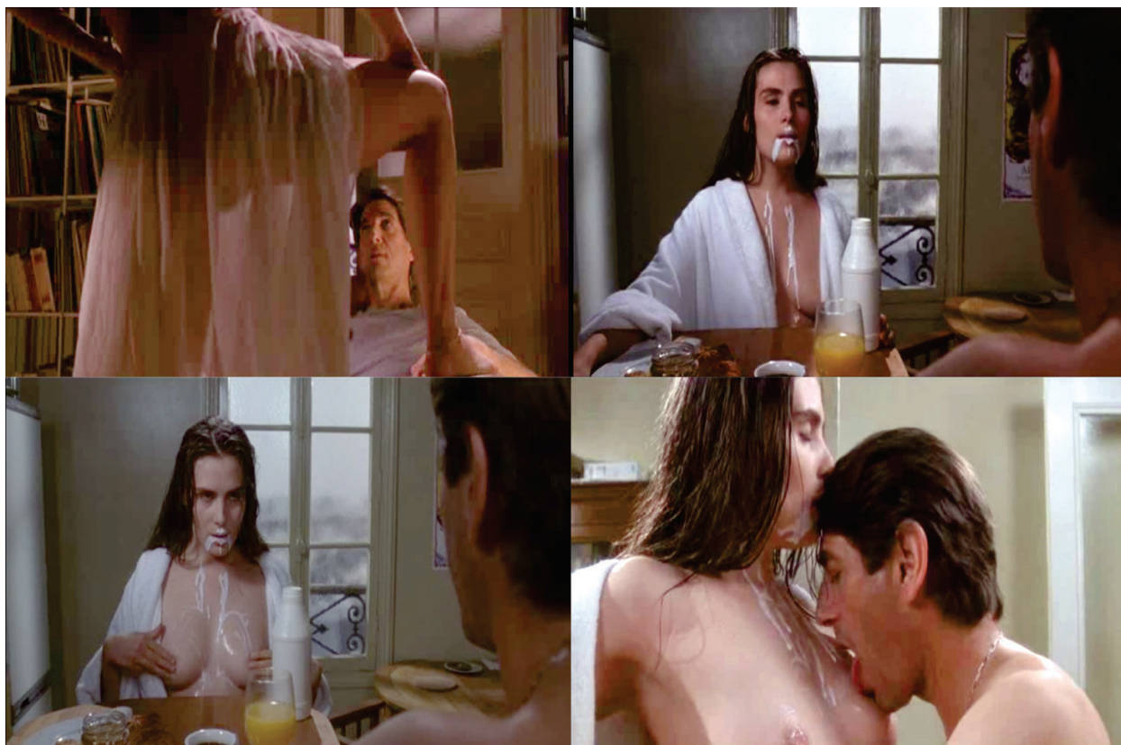
Figura 6 – Amor e sexo: descobertas, revelações.

“a eternidade para mim, começou um dia em Paris, no ônibus 96, trajeto entre Montparnasse e Porto des Lilas” (LUA, 1992). Ao vê-la, vislumbrara o paraíso. A reencontra mais tarde como garçonne, marcam jantar e, desse dia em diante, confinam-se em casa, para viver o amor intenso. Mimi exalava frescor e inocência, misto de maturidade sexual e ingenuidade, o que tocou o coração do boêmio. Ele, o experiente, dono da situação, conduz o romance ao seu modo. Isolados de todos, vivem paixão intensa, esquecidos de que o desejo e o corpo têm limites e que não há necessidade de esgotarem-se em entrega ininterrupta.