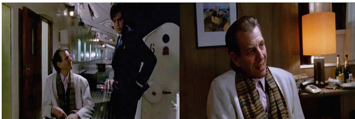
Figura 3 – Primeiro encontro de Nigel com Oscar. Início da erótica e atraente narrativa.

“você quer trepar com ela, isso não é crime” (LUA, 1992). Ou seja, o sádico marido atíça, induz, conduz o boneco manipulável, agora em suas mãos. Este nada malicioso deixa-se levar, está totalmente atraído pela jovem e quer descobrir como chegar à mulher desejada.