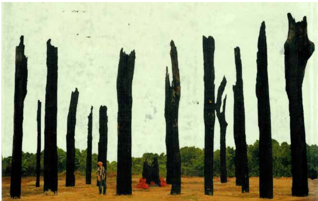
Figura 2 – Registro de As Castanheiras de Eldorado dos Carajás, obra coletiva realizada com a coordenação de Dan Baron, 1999.

heterogeneidade de formas, práticas e circuitos de recepção relacionados a cada exemplo em particular. Não obstante, essa heterogeneidade não será abordada, privilegiando o enfoque nas maneiras como essas obras são capazes de articular imagens e práticas memorialistas.