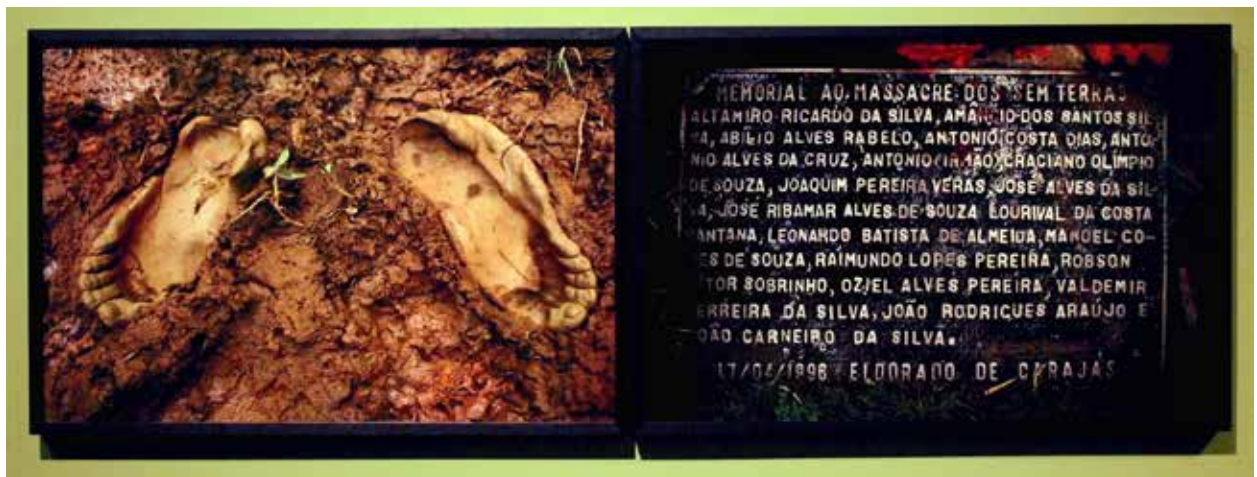
Figura 6 – Ausente presença, Marccone Moreira, 2013.