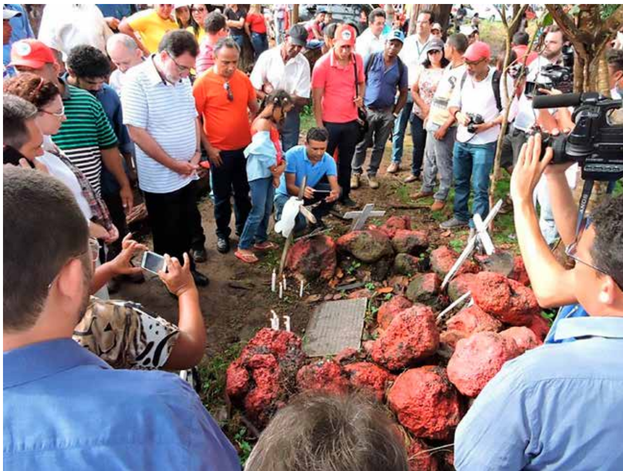
Figura 7 – Uso memorial da obra As Castanheiras de Eldorado dos Carajás na programação de 19 anos do Massacre de Eldorado dos Carajás.