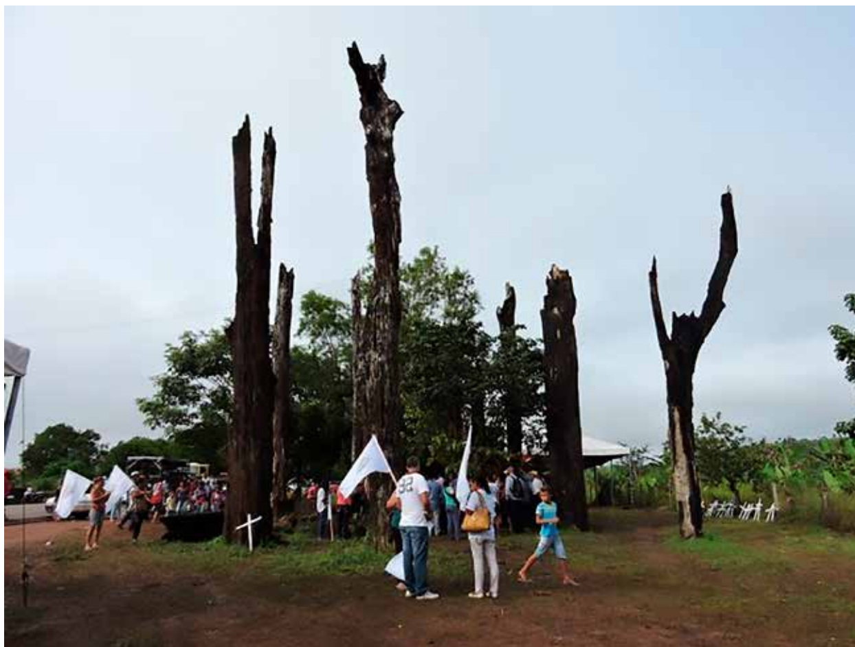
Figura 3 – Registro de As Castanheiras de Eldorado dos Carajás, 17 de abril de 2015.