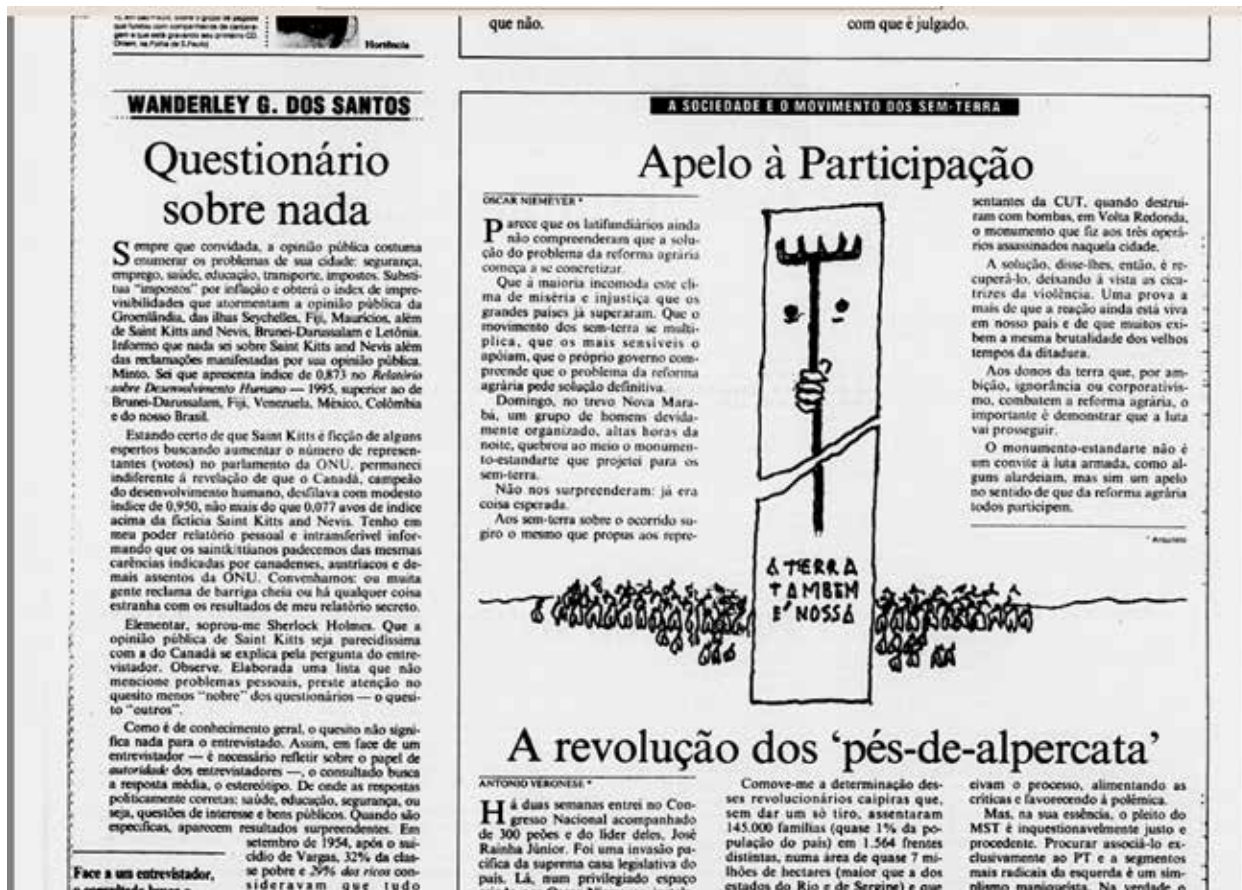
Figura 8 – Ilustração e texto de Oscar Niemeyer a respeito da destruição do Monumento Eldorado Memória em 1996.

lhes conferimos um valor diferenciado de vítimas ou testemunhas da violência, seja porque tais obras passam a ser apropriadas por 'eles' (as comunidades que lhes ajudaram a dar forma).