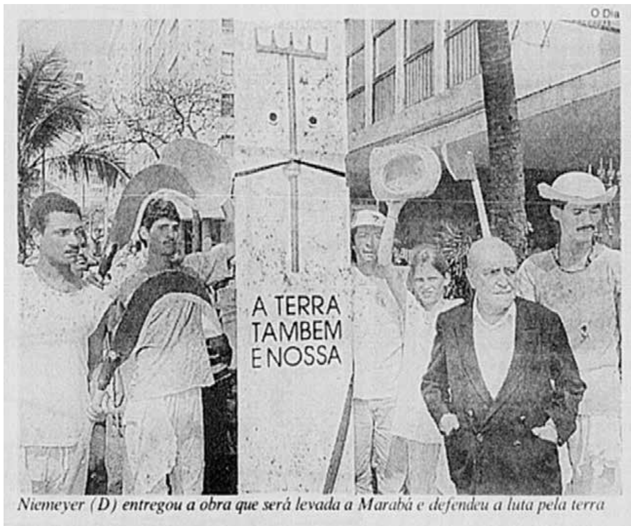
Figura 1 – Registro do Monumento Eldorado Memória, Oscar Niemeyer, 1996.

assassinatos e mesmo chacinas de pessoas em confrontos pela terra. Em abril de 1996, o sudeste paraense era uma região de intensa atuação do MST (Movimento dos Trabalhadores Rurais Sem Terra) pela desapropriação de terras improdutivas e, conseqüentemente, de muita tensão entre camponeses e latifundiários.