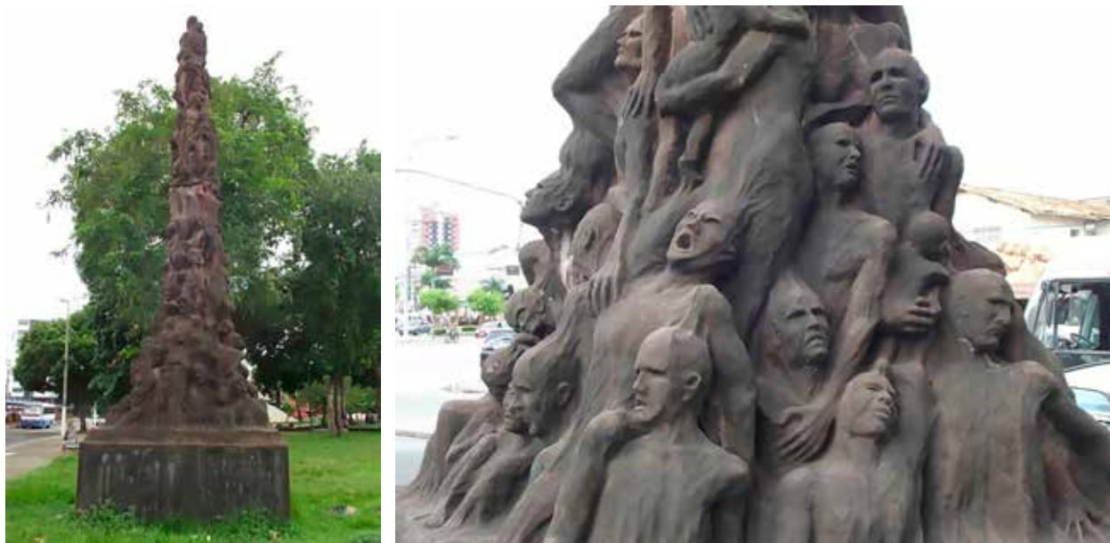
Figura 4 – Registro e detalhe de Coluna da Infâmia, Jens Galschiot, 2000.