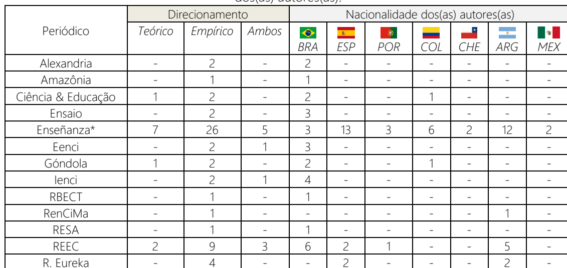
Tabela 3: Distribuição dos artigos selecionados frente à aplicação (teórica ou prática) e nacionalidade dos(as) autores(as).

*Um (01) artigo é de origem israelense. A quantidade total é maior que o número de artigos selecionados porque alguns trabalhos são de autores de diferentes nacionalidades.